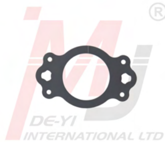
Gioăng Cổ Góp Xả 5316185