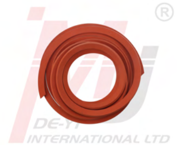
Gioăng Nắp Chụp Cần Gạt 3905449

MJ có một dải sản phẩm đầy đủ cho động cơ Cummins, vui lòng liên hệ với chúng tôi để biết thêm chi tiết. Mọi thắc mắc về mua hàng quốc tế, hãy xem trang Câu hỏi thường gặp của chúng tôi để biết thêm chi tiết hoặc liên hệ trực tiếp với đội ngũ bán hàng của MJ.